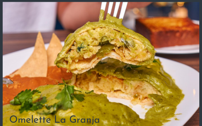
Omelette La Granja

Tres huevos revueltos con machaca y verdura, frijoles de la casa, salsa tatemada, queso guisado y tortillas de harina.